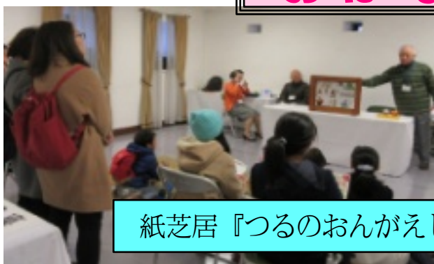
紙芝居『つるのおんがえし』