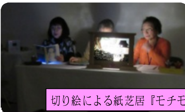
切り絵による紙芝居『モチモチの木』